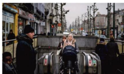
Una zona de cuatro es el barrio de Molenbeek de Bruselas. ANDREW TESTA