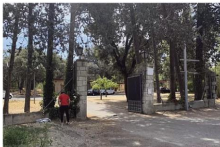
Un joven, a las puertas del centro de menores de la Casa de Campo.

El alcalde asegura que reforzará las patrullas en Batán, Casa de Campo y Alto de Extremadura tras los últimos asaltos violentos a los vecinos