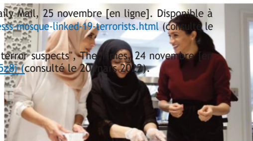
The duchess visited the Al Manaar Muslim Cultural Heritage Centre as part of a charitable project

The Duchess wrote a foreword to a recipe book produced by women at the kitchen and has been making regular visits. The latest came last Wednesday.